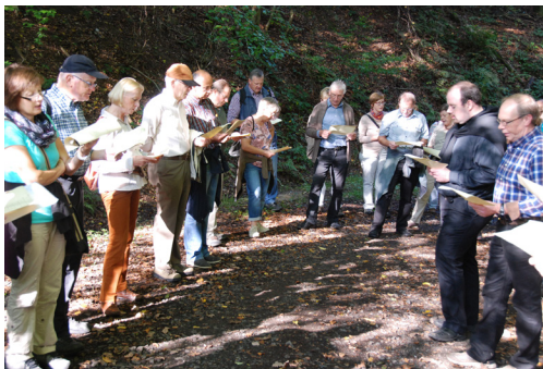
Ehrenamtstag Wanderung mit geselligem Ausklang